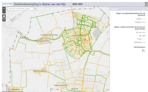
Figuur 1 Strooiroutes

Informatie over de gladheidsbestrijding staat op de website van de Gemeente Alphen aan den Rijn onder bereikbaarheid 1 en in nieuwberichten 2 . Op sociale media (Facebook en Twitter) wordt melding gemaakt.