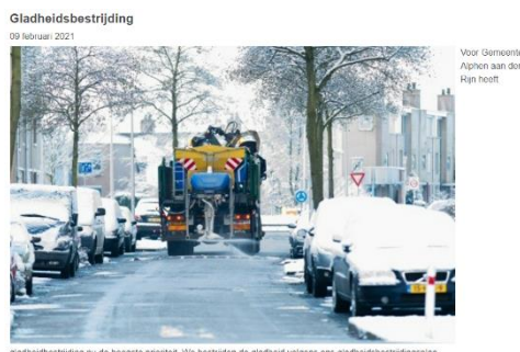
Figuur 2 Nieuwsbericht over Gladheid